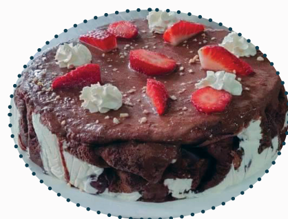
Венислав Иванов, 9 б клас

От шоколадови екстази до леки плодови деликатеси, десертите ни изкушават с вкусове и аромати, които събуждат сетивата и обгръщат с уют. Въпреки че те се смятат за финалния акцент на вечерята, десертите са повече от просто сладки ястия - те са израз на кулинарно изкуство и творчество. В часовете по учебна практика – „Кулинарни техники и технологии“, учениците от 11 б клас и 12 б клас, професия „Готвач“, приготвиха разнообразни основни ястия и десерти.